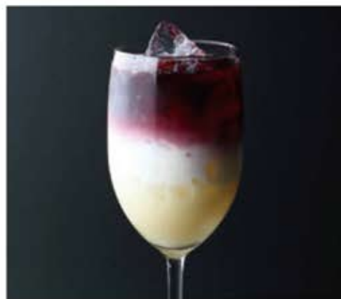
ホワイトハイビスカス ¥800

人気の自家製サングリアを スパークリングワインでスッキリとした カクテルにしました。