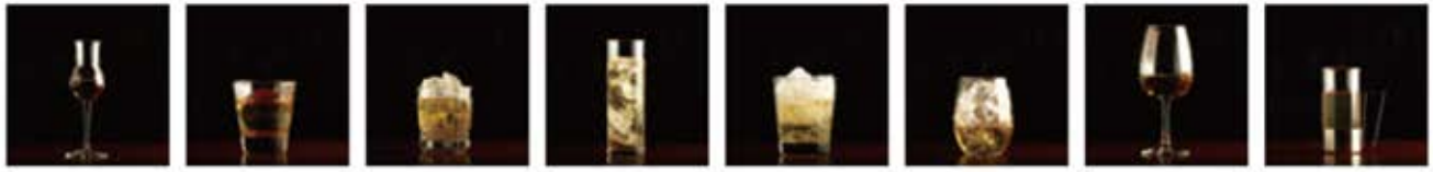
ストレート ロック ハーフロック 水割り ハイボール ミスト トワイスアップ ホット