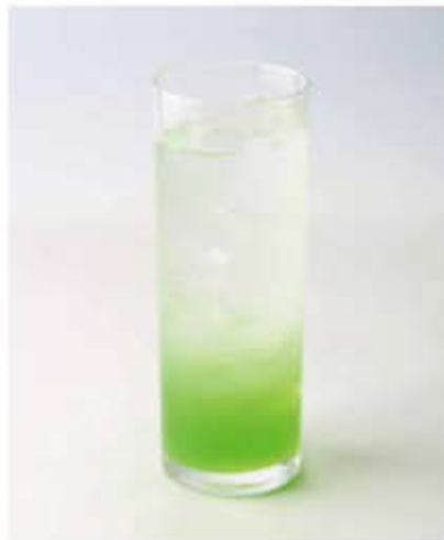
グリーンアップル ¥700